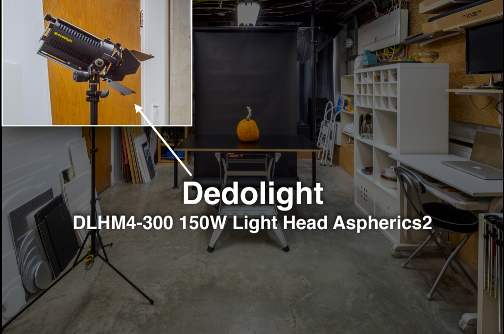
Dedolight DLHM4-300 150W Light Head Aspherics2